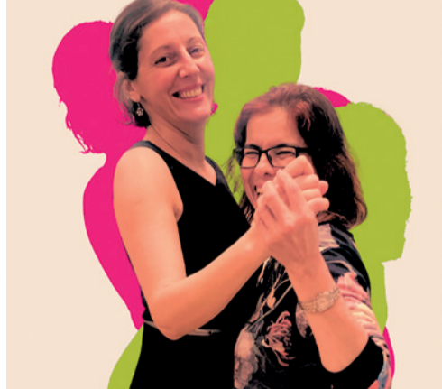
Forró Unterricht macht gute Laune

Do, 18-19.30 h, Allerlei-Raum FORRÓ Ein Paartanz, ursprünglich aus dem Nordosten Brasiliens. Der Tanz ist einfach zu erlernen und reisst einen schnell mit. Forró wird Barfuß oder mit flachen, einfachen Schuhen getanzt. Ihr benötigt keine*n feste*n Tanzpartner*in um bei dem Kurs mitzumachen. Die Teilnahme findet auf Spendenbasis statt. Kontakt: forrogoettingen@gmail.com. Ianna 0163 -7684409. Klara 0152-33571713. Mehr Infos: instagram @forrogoettingen